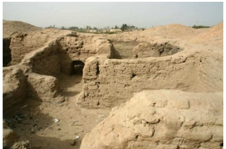
Savitiilirakennusten jäänteitä arkeologisilla kaivauksilla Egyptissä