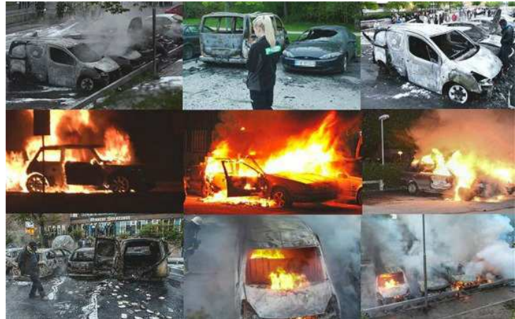
Autojen rikolliset polttamiset ovat Ruotsissa arkipäivää

Tammikuussa Ruotsissa ilmoitettiin aikeesta lähettää jokaiseen kotiin informaatiojulkaisu: ”Jos kriisi tai sota tulee”. Viranomaisten mukaan syynä on ”tilanteen kiristyminen lähialueilla”. Tässä yhteydessä on viitattu erityisesti Venäjän taholta tulevaan uhkaan. Informaatio lähetetään 4,7 miljoonaa kotiin touko-kesäkuussa 2018. Siinä annetaan ohjeita paitsi sotatilanteen myös eri kriisien varalta. Eräiden arvailujen mukaan informaatiojulkaisu palvelisi myös sitä tarkoitusta, jos Ruotsissa värvätään armeija puhdistamaan muslimimaahanmuuttajien asuinalueet rikollisista aineksista. Tätä mahdollisuutta Ruotsissa ovat siis eräät viranomaiset ja poliitikot esittäneet. Toistaiseksi Ruotsi ei ole vielä löytänyt riittävän hyviä keinoja väkivaltaisuuksien kitkemiseksi. Kun ollaan naivisti hyväuskoisia maailmanparantajia ja oman maan sekä kansan tarpeet jätetään toiselle sijalle, jälkiä on vaikea, ehkä jopa mahdotonta enää korjata. Suomen päättäjien tulisi tämä asia rehellisesti tiedostaa ja tunnustaa sekä olla tekemättä sanoja virheitä.