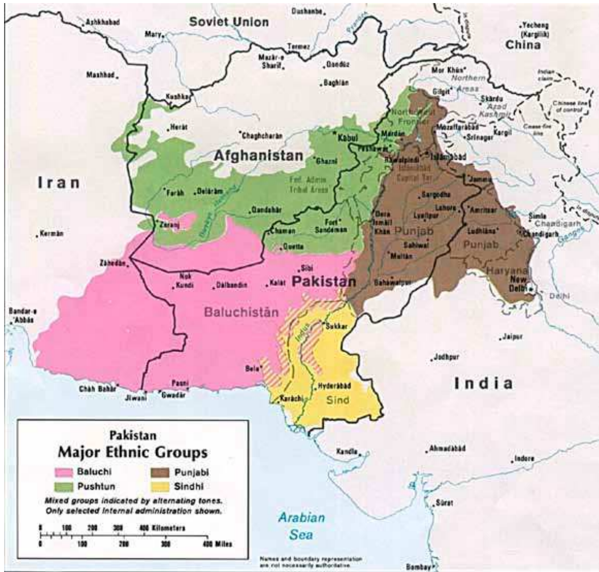
Pataaniien alue vihreällä