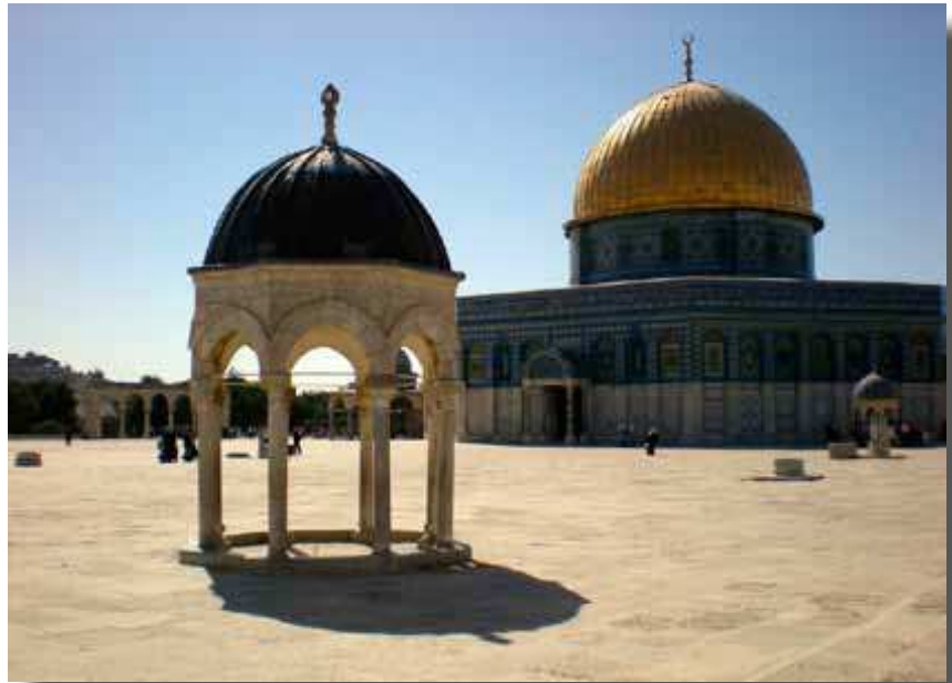
Dome of the Tablest -kupoli