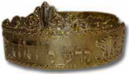
Ylipapin kultainen kruunu

tonarkki, sillä se oli kadonnut. Liitonarkin paikan kaikkein pyhimmässä täytti kivi-paasi, jolle ylipappi sovituspäivänä toi suitsutusastian.