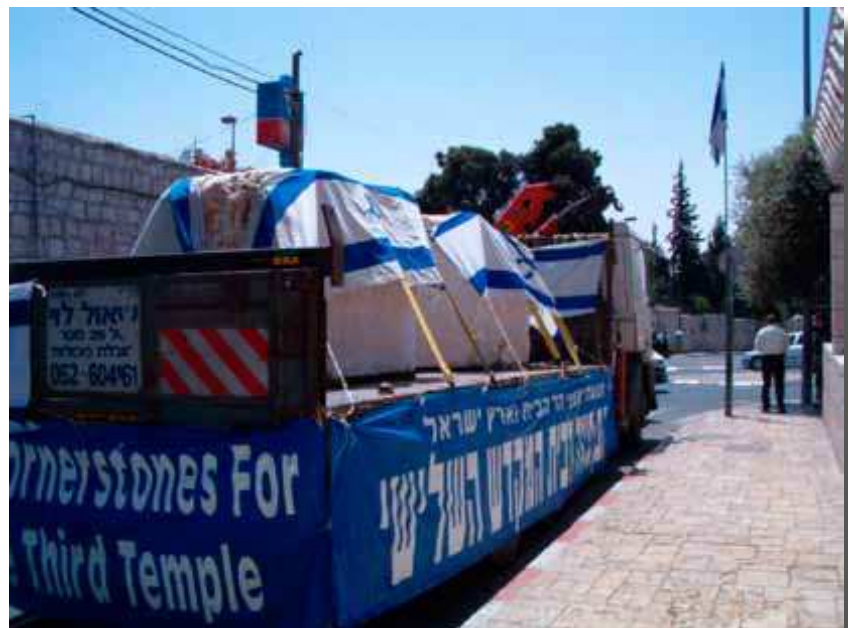
Temppeli-instituutti on näytellyt valmistamiaan temppelin kulmakiviä – tässä vuonna 2007