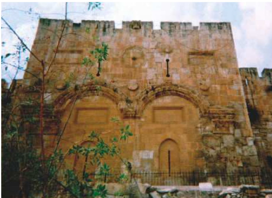
Vanhan tradition mukaan Messias saapuessaan astuu tempelivuorelle tästä suljetusta portista.

► taan nähdä silloin siellä, missä sitä ei ole. Ihmiskunnia, työn menestyminen, yms. - vaikka toimintatapa ei alistu Sanan auktoriteetin alle, voidaan tulkita Jumalan siunaukseksi.