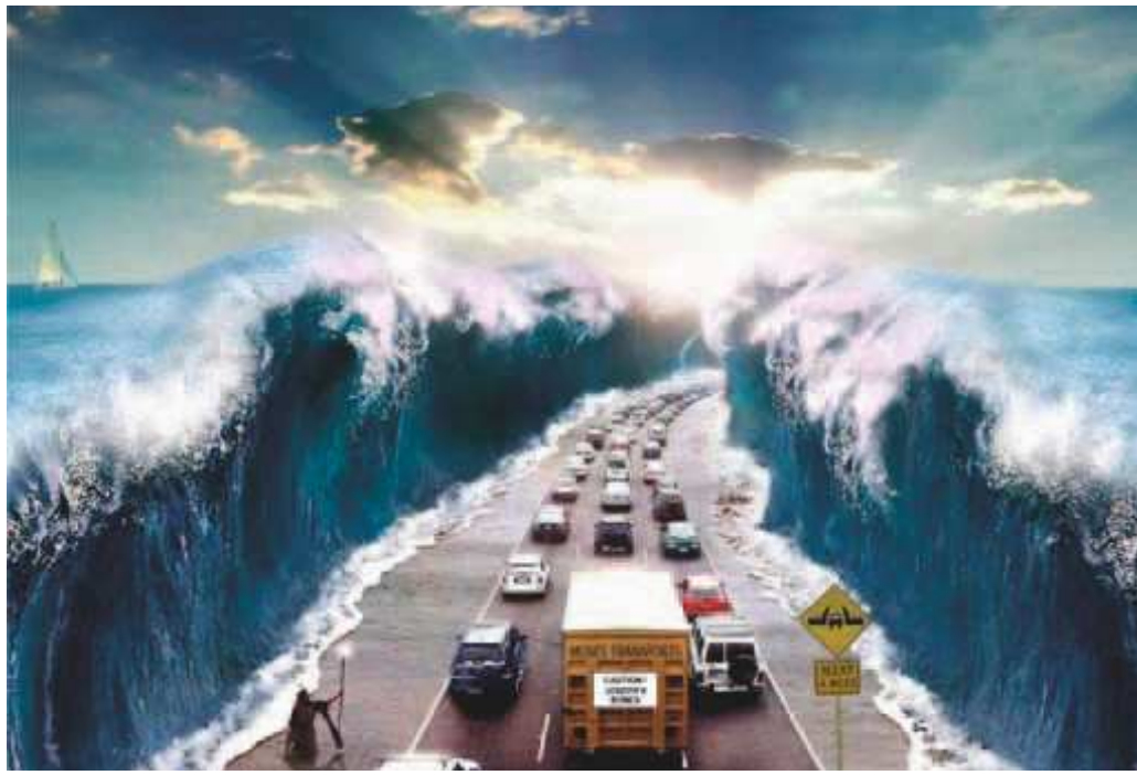
Viimeinen suuri juutalaisten exodus tapahtuu Messiaan saapuessa.

Kristillisen suurlähetystön entinen puhemies vieraili vuosia sitten Ruotsissa menestysteologia-linjaan lukeutuvan ”Elämän Sana” -seurakunnan Israel-juhilla. Haastateltuna 1990 ko. tilaisuudessa, hän kertoi lähetystön näkemyksestä: ”Kun he (juutalaiset) ovat palanneet maanpäälliseen Israeliin täysilukuisina, on Jumala vuodattava Henkensä heidän päälleen ... Raamatussa ei lue, että Jumala vuodattaisi Henkensä juutalaisten ylle Miami Beachissa, New Yorkissa tai Tukholmassa.