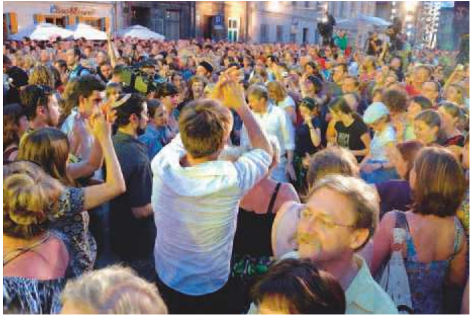
"kansat ottavat heidät ja tuovat heidät heidän kotiinsa..."

Suomessa eniten vaikuttava kristillinen sionismijärjestö on perustellut maallisen Israelin taloudellista tukemista: ”Israelin viholliset ovat pyrkineet myös maan taloudelliseen eristämiseen, ja sen vastapai-