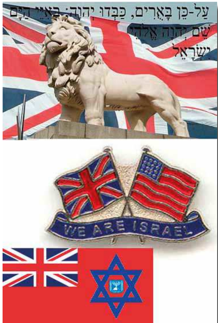
British Israelism symboleita

Hine sovelsi aikansa poliittista kehitystä Raamatun profetiaan varsin vapaasti. Raamatun siunaukset kuuluvat nyt tunnistetuille Israelin kansakunnalle. Toisin kuin maailman tuntema Juuda, juutalaiset, ”Is-