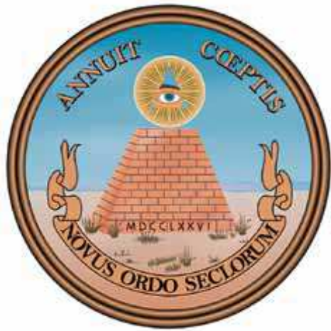
The Great Seal of the United States

sessä mukana olleet vapaamuurariuden symbolit todisteiksi Israelin heimosta. Näitä symboleja (katkaistu pyramidi, kakkennäkevä silmä, kotka, ym.) sisältävä Yhdysvaltain vaakuna (The Great Seal of the United States) todisti monelle kirjoittajalle Amerikan kuulumista Israelin raamatulliseen heimoon. Amerikka on Joosefin toisen pojan Manassen siunausten perijä. ”Manassesta piti tulla suuri kansa... näen tämän lupauksen kirjaimellisen täytymyksen Yhdysvalloissa.” Monissa kirjoituksissa esiintyi suurta kiinnostusta Egyptin pyramideihin. Erityisesti Gizan pyramidilla katsottiin olevan suuri merkitys ”pyramidi on valtava todistus Jumalasta ja hänen kansastaan”, kirjoitti Wild.