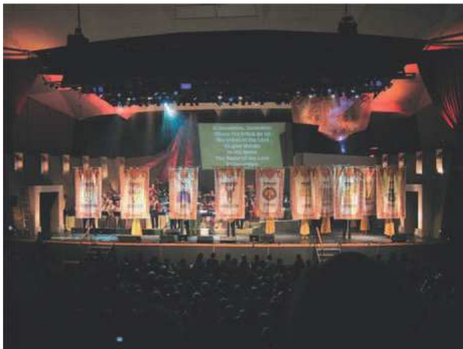
Krist. sionismiliike järjestää suuria ja näyttäviä konferensseja

Kaikki Israelin merkityksen Jumalan valittuna kansana tunnustavat kristityt ovat samaa mieltä humanitäärisen työn tärkeydestä. Kristityn velvollisuus on tehdä voitavansa auttaakseen tarpeessa olevia juutalaisia ja pakanoita ajallisella avulla. Mutta se on seurausta evankeliumin ihmistä muuttavasta vaikutuksesta. Se ei ole erillinen osa erossa evankeliumista, vaan liittyy osana julistukseen ristiinnaulitusta ja ylösnousseesta Vapahtajasta. Puutteessa olevien ihmisten monipuolinen auttaminen kuuluu evankeliumiin. Mutta kristillinen sionismi on antanut tälle auttamiselle toisenlaisen painotuksen. Se liittyy siihen valtiollisen politiikan ja talouden tukemisen. Toinen kansainvälinen kristillinen sionistikongressi Jerusalemissa painotti julkilausumassaan Jesajan 40:1 tar-