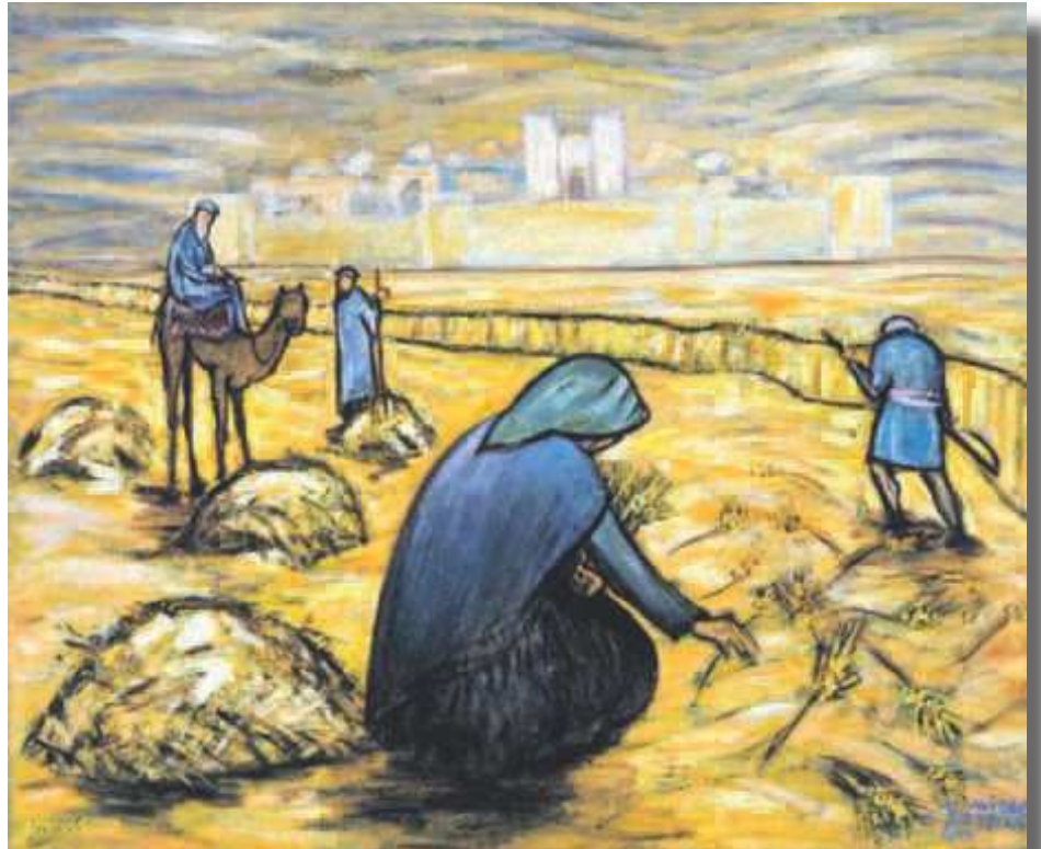
Kuningas Daavidin isoäiti oli moobilainen Ruut

Kansainvälisessä krist. sionismiliikkeessä esiintyy laajalti uskomusta, ettei Israelin enää tarvitse joutua ahdistukseen. Se on jo kärsinyt niin paljon. Ihmisinä haluaisimme siunata Israelia ja luvata sille, että sen takaisin paluu maailman kansojen joukkoon on pelkkää ylämäkeä. ”Daavidin sortuneen majan” valtiolliseen ja uskonnolliseen pystytykseen kutsutaan apuun kristittyjä. Ajatellaan, että esim. kristityt liikemiehet saavat erityisen Jumalan siunauksen liiketoimista Israelin kanssa. Inhimillisesti joidenkin kohdalla saattaa ajatus vaikuttaa silläkin tavalla, että kun Israel nousee kansojen johtoon, niin saadaan itse olla hyötymässä ”samassa veneessä”. Toki tälläkin alueella esiintyy myös vähemmän itsekästä toimintaa. Raamattuun lukeva törmää kuitenkin siihen murhetta ja huolta tuottavaan ilmoitukseen, ettei Israel vielä olekaan oman Via Dolorosansa päässä: ”Oikean Israelin ystävä ja