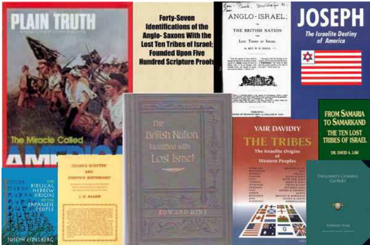
Vanhempaa ja uudempaa julkaisua aiheesta