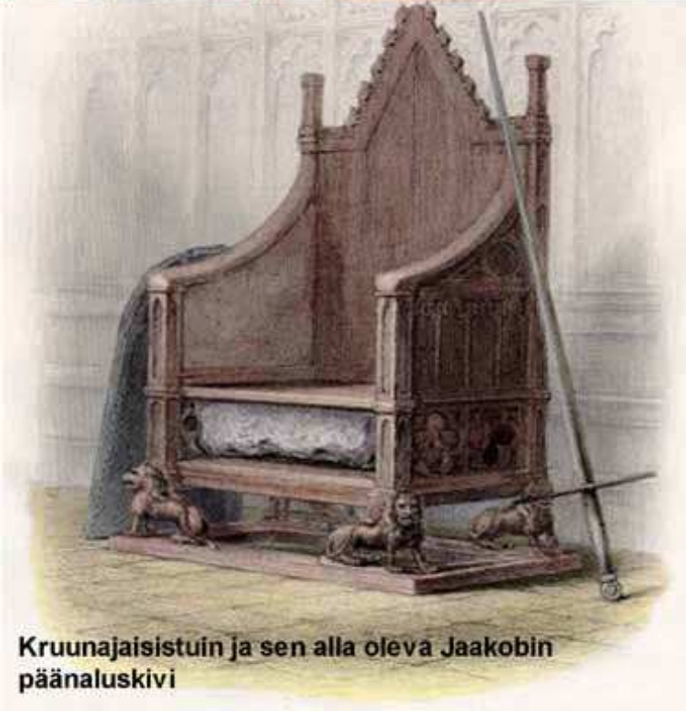
Kruunajaisistuin ja sen alla oleva Jaakobin päänaluskiivi

Tarina Israelin 10 kadonneesta heimosta on ollut monen mielenkiinnon kohteena erityisesti viimeisten parinsadan vuoden aikana varsinkin Iso-Britanniassa. Siksi ko. harrastusta kutsutaan myös nimillä Anglo-Israelism ja British-Israelism. Pääväittäjä on, että lähinnä Länsi-Euroopan maiden kansalaiset, erityisesti Iso-Britannian, koostuvat Israelin 10 kadonneen heimon jälkeläisistä (eli niistä Israelin heimoista, jotka vietiin pakkosiirtolaisuuteen Assyriaan ja Baabeliin ja jotka ”katosivat” heimoina maailmankartalta). Kyse on siis Jaakobin 12 pojan jälkeläisistä, poislukien Juuda ja Benjamin, jotka valtakunnan jakauduttua jäivät Juudan kuningaskuntaan. Historia on mielenkiintoista ja vanhojen kirjoitusten tutkimus parhaimmillaan jännittävää ja siksi monet kristityt ovat vuosien aikana olleet aiheesta kiin-