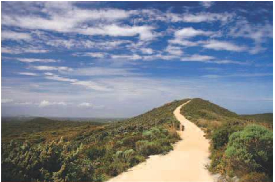
Valmistakaa Herralle tie ... Jeesus: Minä olen tie ...

Voimme todeta näiden tavoitteiden olevan hyviä ja hyödyllisiä. Mutta puhuuko Jesaja tarkoittaen ensisijaisesti näitä tavoitteita? Jesajan kirjan luvusta 40 alkaa tietyn tyyppinen kokonaisuus. Se käsittää lohdutuksen, varoituksen, kehotuksen, nuhtelun, tuomion, toivon, armon ja pelastuksen sanaa Israelille. Tämä kokonaisuus jatkuu Jesajan kirjan loppuun asti. Luvun