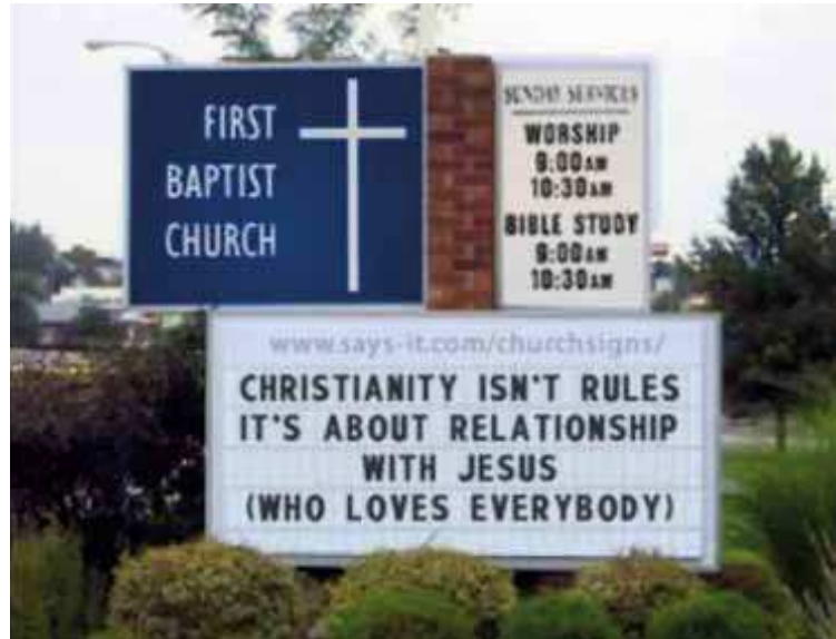
Kristinuskko ei ole sääntöjä vaan henkilökohtainen suhde Jeesuksen kanssa...

Tämän Raamatun selvän ilmoituksen johdosta emme voi täysin yhtyä Lapidin opeutukseen: ”Tie Jumalan luo kulkee lähimmäisen kautta.” On totta, että lähimmäisen rakkaus on Jumalasta ja Hänen tahdonsa. Mutta sitä ennen tulee aina rakkaus Jumalaan. Rakkaus Jumalaan merkitsee Hänen valmistamansa pelastuksen vastaanottamista. Tämän jälkeen Jumala vaikuttaa meissä Pyhän Henkensä kautta aitoa rakkautta ja vastuunottoa lähimmäisiimme nähden. Tästä lähtee oikea, kristillinen humanitäärinen auttaminen. Kirjansa lopulla Lapide kysyy: ”Eikö meidän jo vihdoinkin olisi tulkittava risti uudella tavalla?” Lukijani, millaisena sinä näet Lapidin ja muiden kahden liiton teologien, juutalaisten ja kristittyjen, pyrkimyksen yhdistää, kuten Lapide toivoo ”kirjon ja synagogan tiet”? Millaista Jeesusta tarjotaan juutalaisille, kristityille, niille jotka rakastavat Israelia? Kuinka tämä auttaa sinua paremmin ymmärtämään UT:n Kristusta, kuten kirjan alussa luvataan?