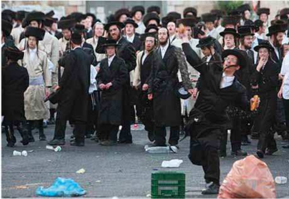
Ortodoksijuutalaiset mellakoivat Jerusalemissa sapatin rikkojia vastaan.