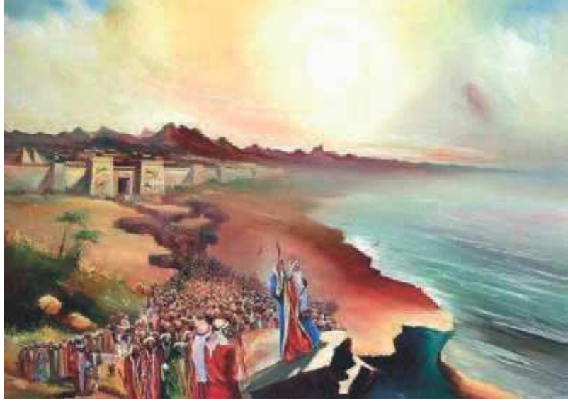
Ja israelilaiset lähtivät liikkeelle... 2. Moos. 12:37