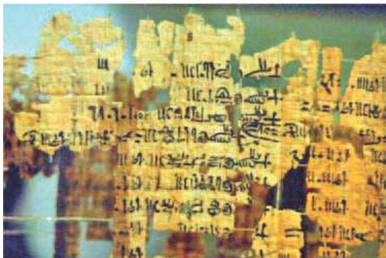
Osa Turin Royal Canon papyryksestä.