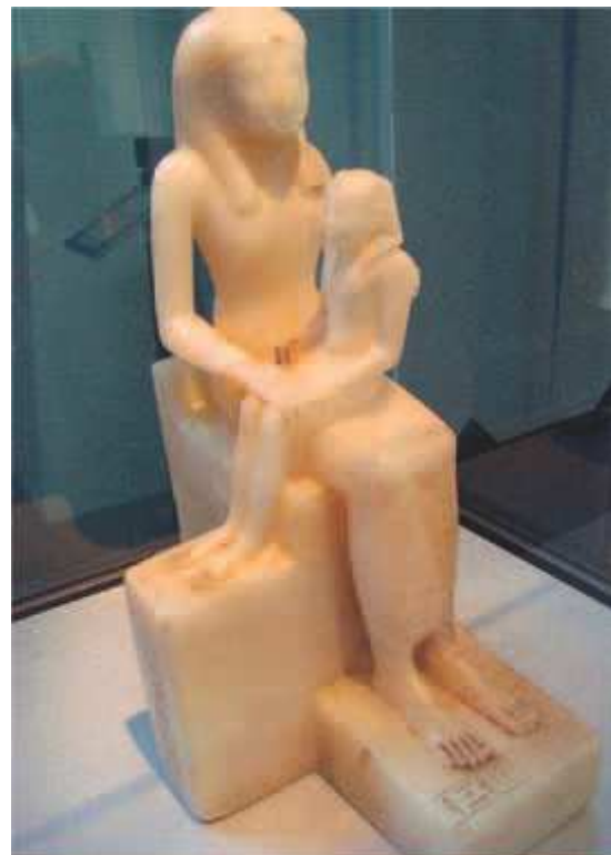
Egyptiläinen veistos esittää jo lapsena faaraoksi nousseen Pepi II äitinsä sylissä.

Se, että papyruskääröä tulkitaan lähtökohtana Raamattu, ei ole monenkaan tutkijan mieleen. Monet selittävät sen olevan vertauskuullinen tai tarunomainen selitys joillekin Egyptin historian tapahtumille. Niinhän Raamattuunkin paljolti suhtaudutaan, sitä ei tahdota pitää kirjaimellisenä totena. Israelilaisten mukana Egyptistä lähti paljon ”sekakansaa”, eli ei-juutalaisia. Raamattu mainitsee siitä 2. Moos.12:38. Niin suuren joukon yht'äkkäinen lähtö Egyptistä ja siirtyminen toiselle alueelle oli mullistavaa paitsi lähtöpaikassa myös siellä minne saavuttiin. Historiantutkimus vahvistaa, että muinaisessa Kanaanin maassa varhaisen pronssikauden aikana eläneet kansat olivat tavoiltaan julmia epäjumalanpalvojia. Nykykäsityksen mukaan tämä pronssikausi päättyi n. 2200 eKr. paikkeilla. Tuolloin nämä kansat hävisivät kartalta suhteellisen nopeasti. Aiemminkin syyksi on esitetty mm. kansainvaelluksia mutta israelilaiset eivät ole helposti sopineet kuvaan. Teoriaan on liitetty Aabraham, joka olisi ollut yksi Mesopotamiasta lähteneestä suuresta joukosta. Monet tutkijat ovat sittemmin lähestyneet Raamatun kuvausta tapahtumille: suuri ihmisjoukko saapui Kanaanin maan rajoille, ylitti rajan Kuolleen meren pohjoispuolella ja alkoi vallata maata. Joku arkeologi on uskaltanut jo arvioida, että tämä joukko olisi ollut Israelin kansa. Mm. 1983 Rudolp Cohen julkaisi asiaa käsittelevän artikkelinsa Biblical Archaeology Review -lehdessä. Ongelmallista on, että nykyisen yleisesti hyväksytyyn histo-