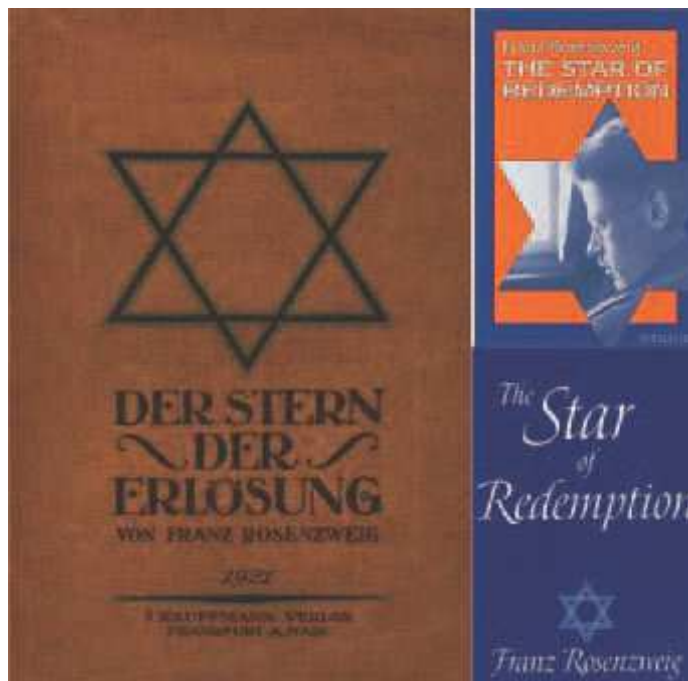
”Lunastuksen Tähti”, vas. saksankiel. alkuperäinen versio