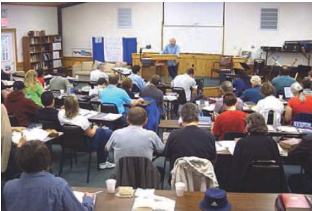
Raamatun opiskelua messiaanisisessa srk:ssa.

todistuksensa oikeaksi. Juutalaisen uskonnon edustajat antavat ymmärtää, että messiaanisten juutalaisten hyväksyntä kristillisessä seurakunnassa voi vaikeuttaa juutalaisten ja kristittyjen suhteita muilla tasoilla. Olemme Raamatun ja historian valossa katselleet juutalaisuuden ja kristinuskon taustaa. Meidän on selkeästi tunnustettava messiaanisten juutalaisten asema seurakunnassa. Todellisen Israelin ystävän näky on Paavalin tavoin huoli kansan ja yksilöiden pelastuksesta, Kansan, jonka eräät kristilliset vaikuttajat opettavat nyt jo olevan toimivassa liitossa Jumalan kanssa. Tämä opetus ei saa tukea Raamatusta. Todellinen Uusi liitto solmitaan vain Jeesuksen kautta – tähän täydelliseen liittoon Vanha liittokin lopulta tähtää.