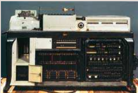
IBN:n kehittämä reikäkorttikone.