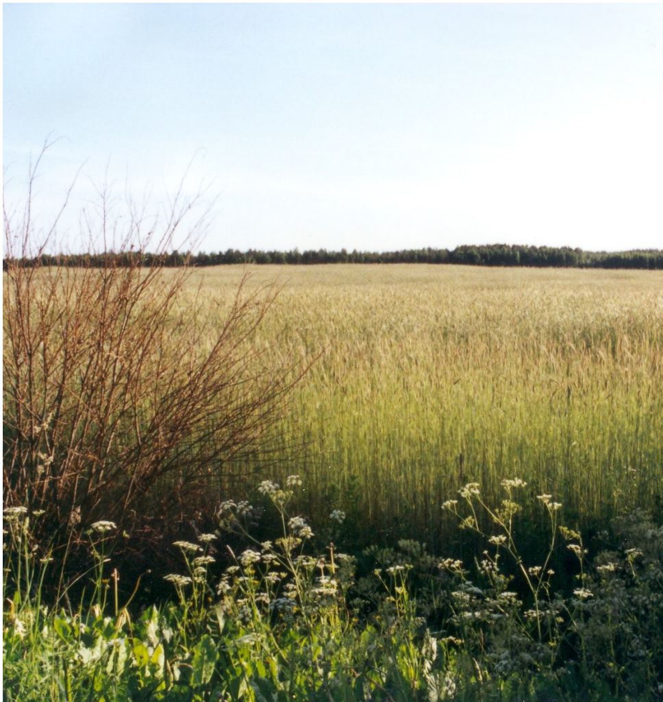
Ruis kypsymässä Kylmälahden maisemassa Imatralla.